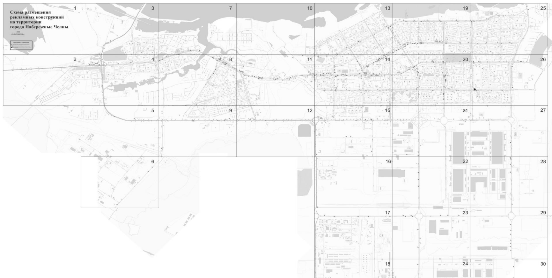
Схема размещения рекламных конструкций на территории города Набережные Челны (в новой редакции)

Приложение № 1 к постановлению Исполнительного комитета от «13» января 2021 №35